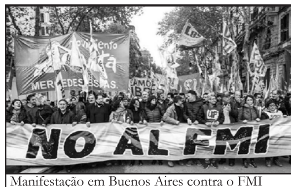
Manifestação em Buenos Aires contra o FMI

É uma utopia reacionária acreditar que se pode pagar dívida pública, como fez Syriza na Grécia em 2015, capitulando à “Troika” (FMI, Banco Central Europeu, Comissão Europeia) e traíndo o “Não!”, que levou milhares às ruas. Retornemos a palavra de ordem de “Não pagamento da dívida externa e interna”. Reeditemos c a m p a n h a s internacionais de rua, como as dos anos de 1980, que elegeram 23 de outubro como Dia Internacional pelo Não Pagamento da Dívida Externa!